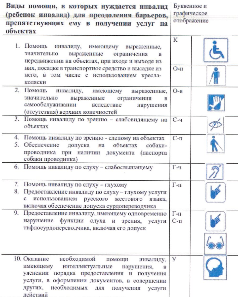
Рис. 4.1. Раздел ИПРА «Виды помощи, в которых нуждается инвалид (ребёнок-инвалид) для преодоления барьеров, препятствующих ему в получении услуг на объектах»

Решение об организации помощи на объекте силами сотрудников учреждения (организации) обеспечивается комплексом организационных мероприятий, в том числе локальными организационно-распорядительными документами, закреплением ответственных сотрудников за организацию и оказание помощи на объекте инвалидам и другим маломобильным гражданам, а также обучением (инструктированием) персонала учреждения (организации) с отражением этой информации в плановых и учётных (регистрационных) документах.