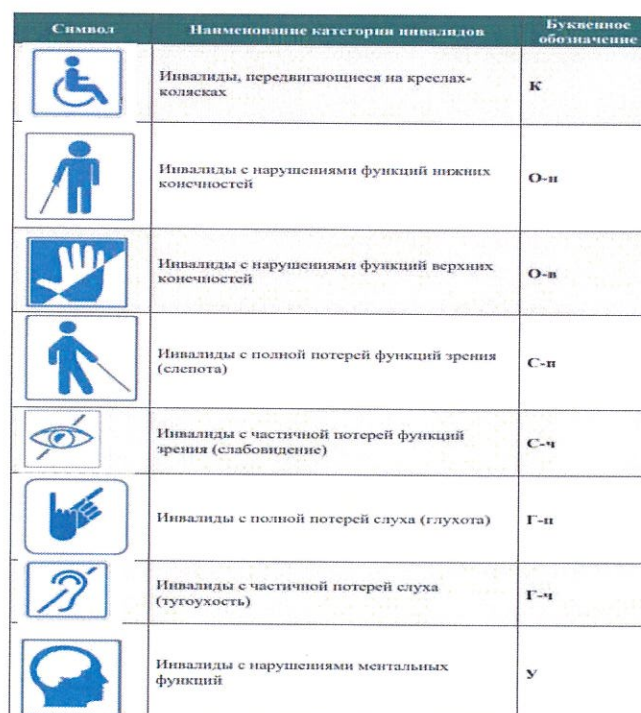
Рис. 2.1. Категории инвалидов